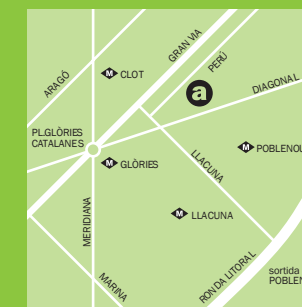
Can Jaumandreu / Empleo

Acceso Metro L1 Arc de Triomf / L4 Jaume I Cercanías R2 Estación de Francia / R1 R3 R4 y R7 Arc de Triomf Bus 14 / 39 / 40 / 41 / 42 / 51 / 42 / 141 / B25 Tranvía T4 Wellington