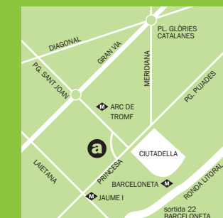
Convent de Sant Agustí / Empleo

Programa cofinanciado por el Fondo Social Europeo mediante el Ministerio de Política Territorial y el Ayuntamiento de Barcelona - Barcelona Activa