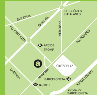
Convent de Sant Agustí / Ocupació

Programa cofinançat pel Fons Social Europeu mitjançant el Ministeri de Política Territorial i l'Ajuntament de Barcelona - Barcelona Activa.